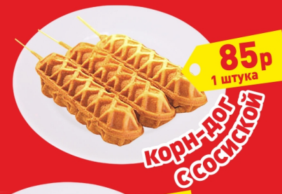
КОРН-ДОГ С СОСИСКОЙ