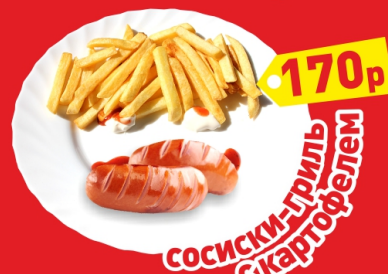
СОСИСКИ-ГРИЛЬ С КАРТОФЕЛЕМ